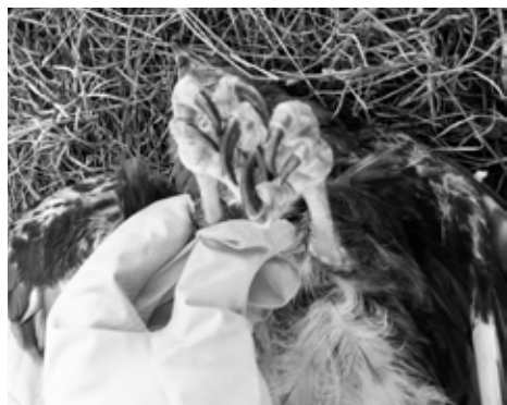
Karakteristično zgrčene kandže kod trovanja

Ko kršeći propise ubije, povrijedi ili muči životinju, kazniće se novčanom kaznom ili zatvorom do jedne godine. Ko ubija ili povređuje životinje koje pripadaju posebno zaštićenim životinjskim vrstama, kazniće se zatvorom od šest mjeseci do pet godina.