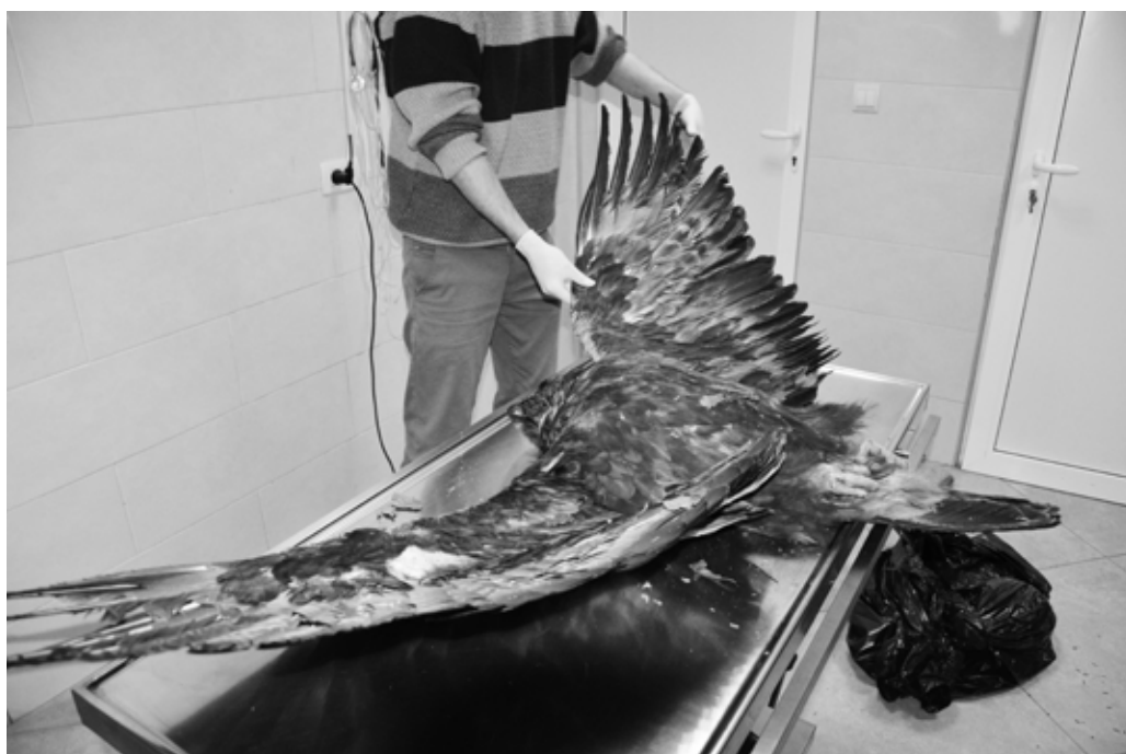
Otrovana velika ušara

Trovanje predstavlja namjerno podmetanje otrova u svrhu ubijanja određenih vrsta ptica ali ono uključuje i nenamjerno trovanje putem otrovanog plijena, mamaca ili sjemena namjenjenih drugim životinjama.