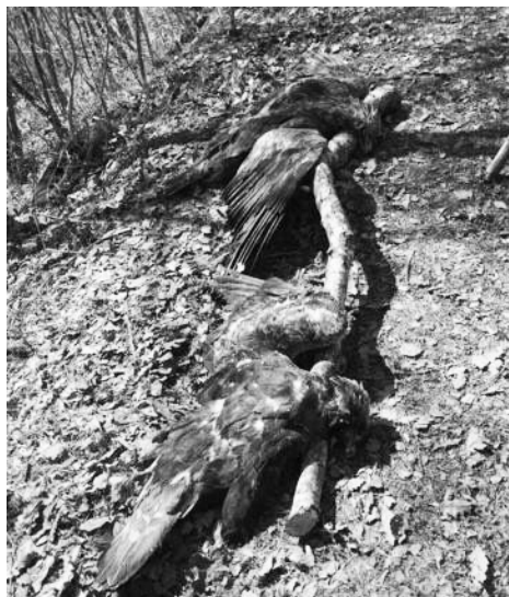
Karakterističan položaj tijela ptice ispruženih krila okrenute ka zemlji