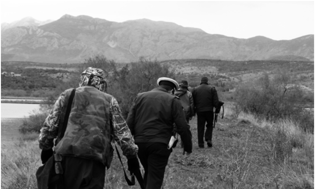
Privodjenje krivolovaca na Ulicijskoj solani