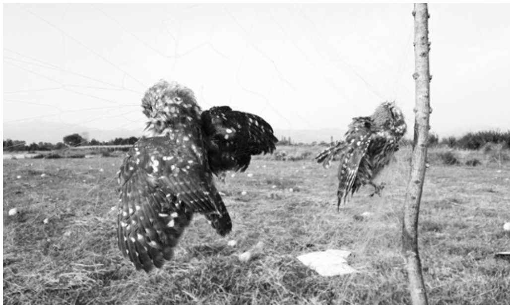
Otrovana velika ušara